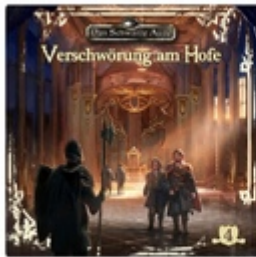
Folge 4: Verschwörung a... 2018