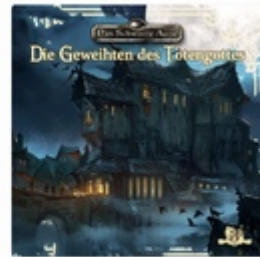
Folge 3: Die Geweihten de... 2018