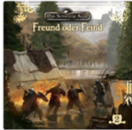
Folge 2: Freund oder Feind 2018