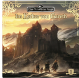
Folge 1: Im Kerker von Gar... 2018